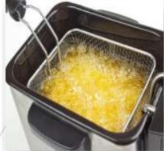
Freir / Fritar