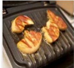
A la plancha