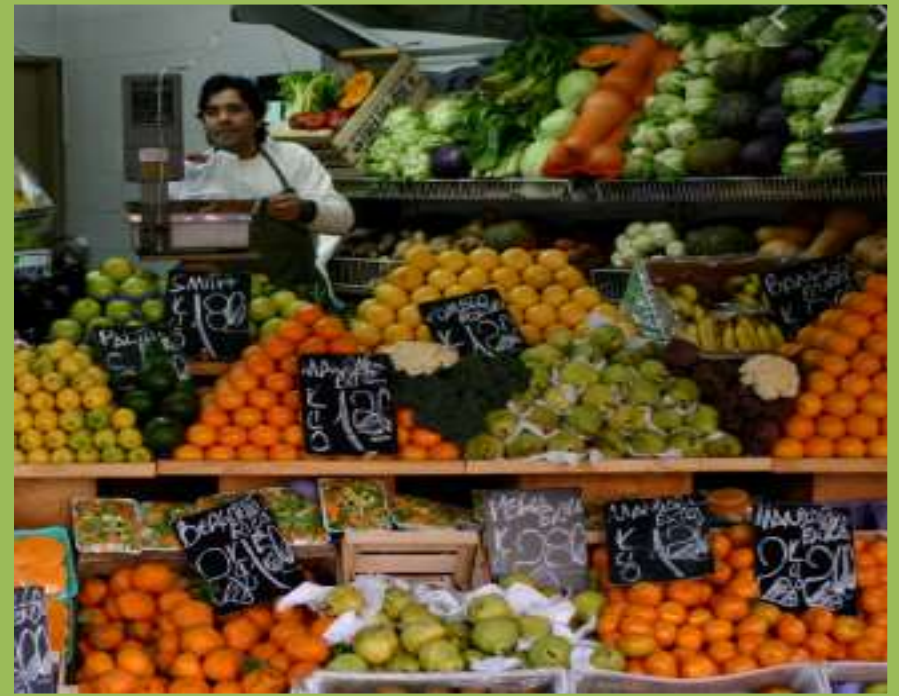
La frutería La verdulería