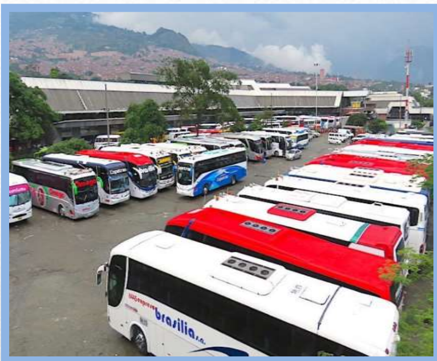
La estación de buses