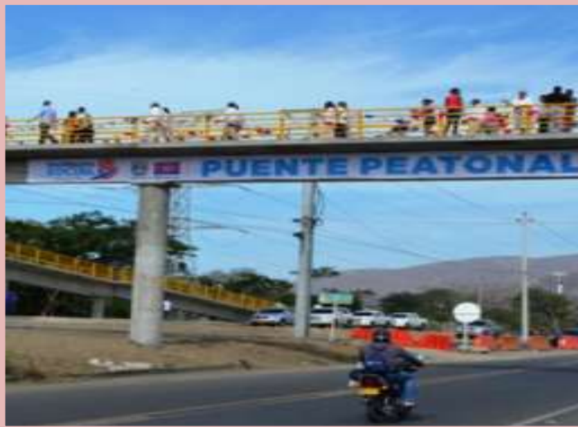
El Puente peatonal