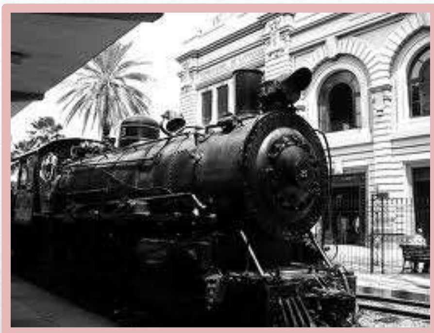
La estación de tren