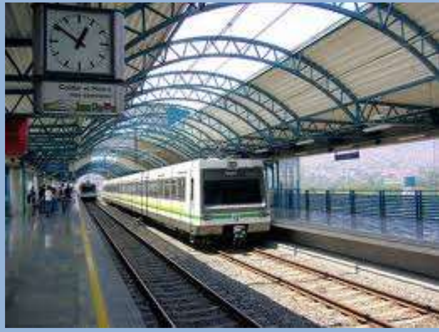
La estación de metro