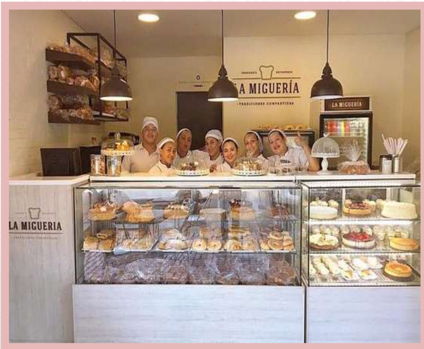
La pastelería La repostería