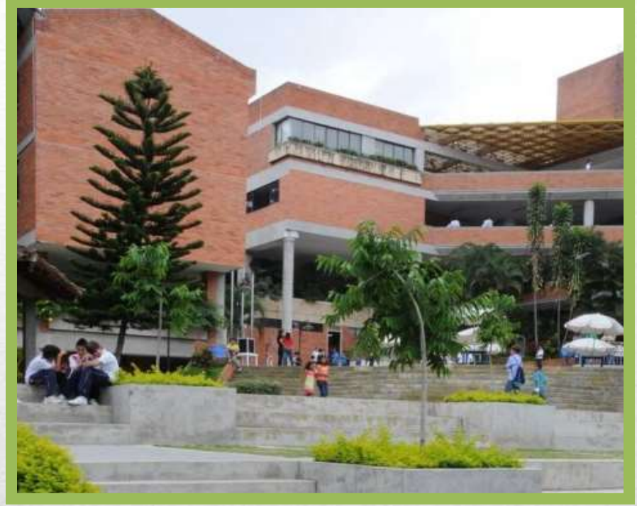
La escuela El colegio