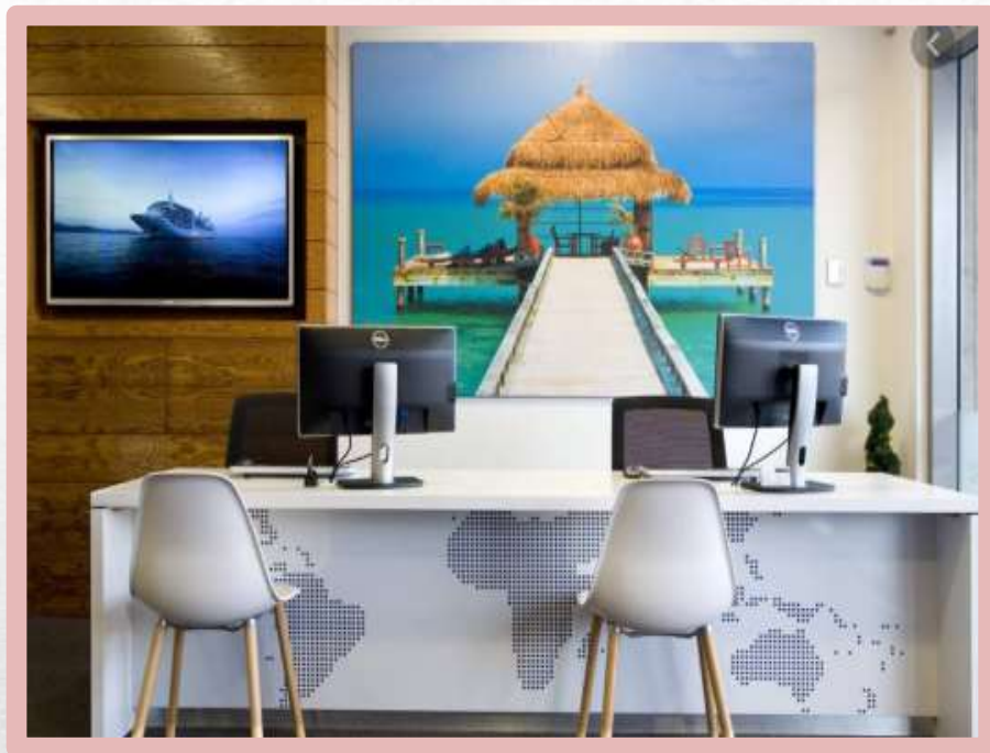
La agencia de viajes