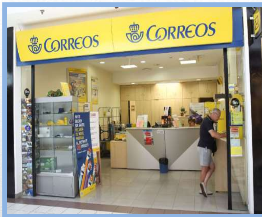
La oficina de correos