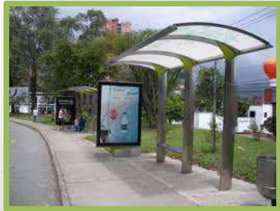
La parada de bus