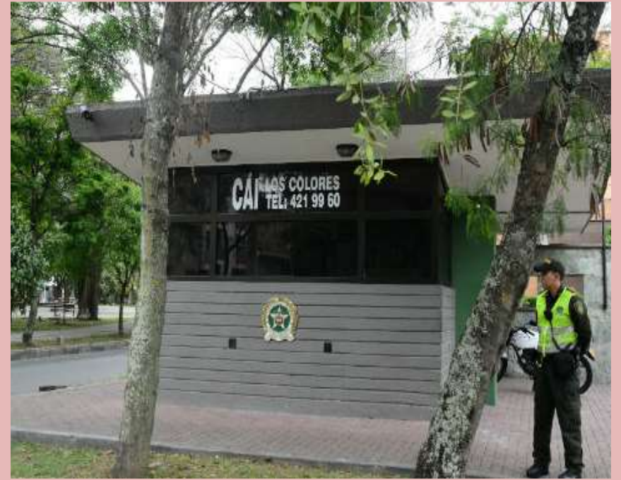
La estación de policía La comisaría