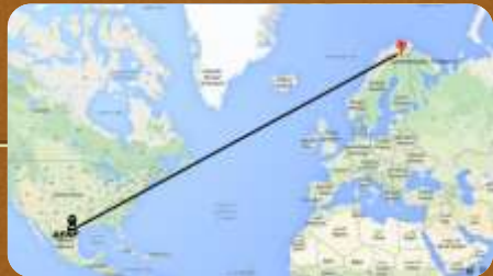
(trasladar-me) a Finlandia