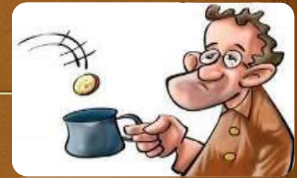
(ser) muy pobre