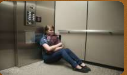
(quedarse) atrapado ascensor