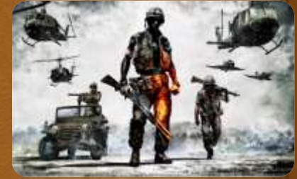
No (haber) guerras