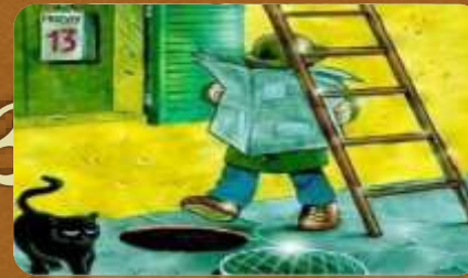
(tener) mala suerte