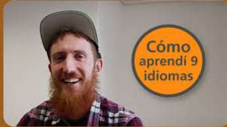
(hablar) 9 idiomas