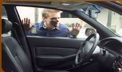
(perder) llaves carro